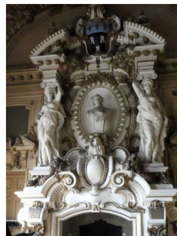
L'Hôtel de ville de Tours