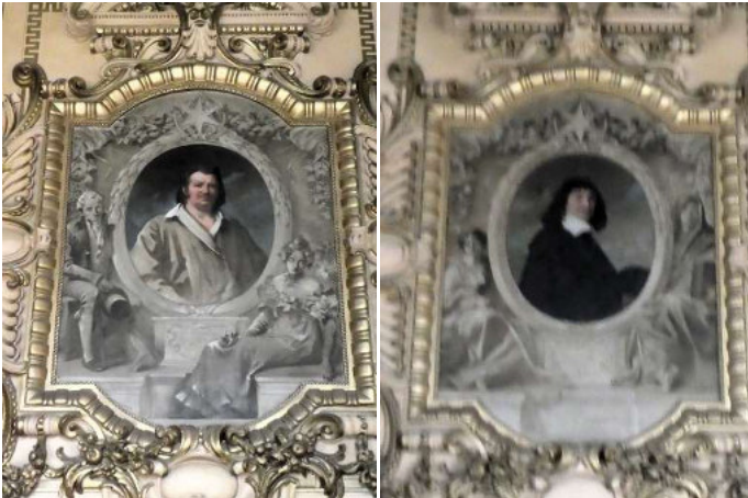
Balzac, Descartes, Rabelais et Vigny, les locaux de l'étape