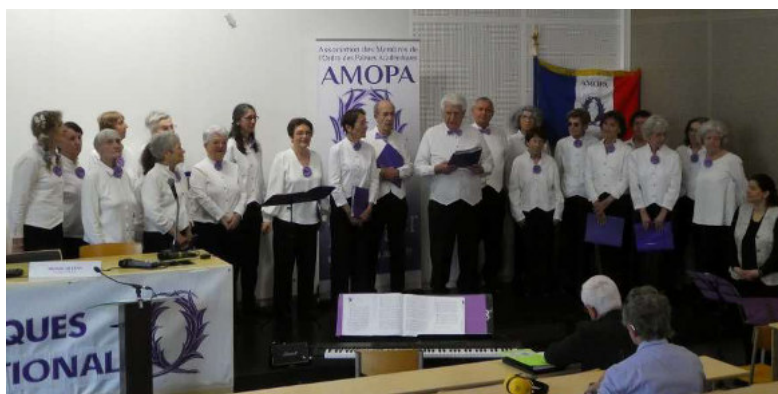
Le chœur de l'AMOPA