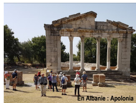
En Albanie : Apolonia