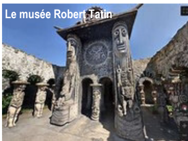
Le musée Robert Taft