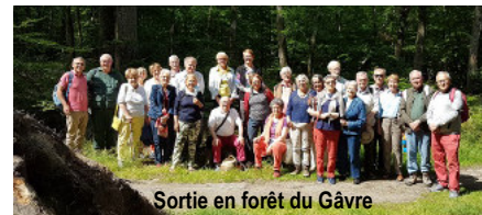
Sortie en forêt du Gâvre