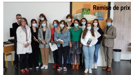
Remise de prix