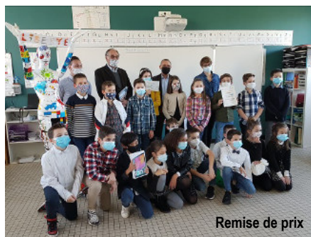
Remise de prix