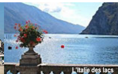
L'Italie des lacs