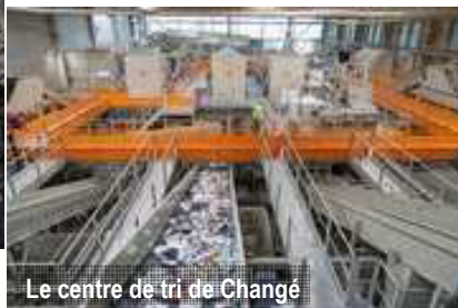
Le centre de tri de Changé